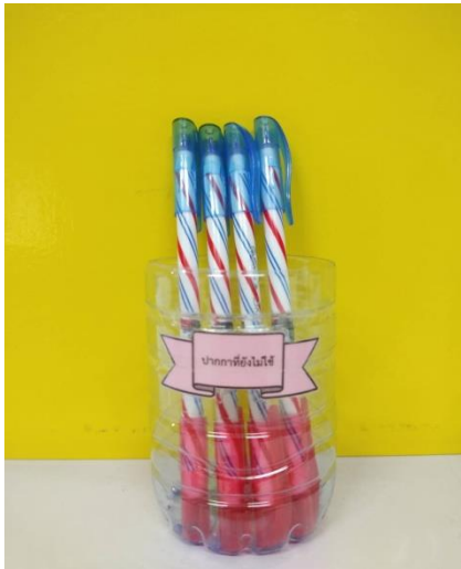
1 ปากกที่ยังไม่ได้ใช้งาน